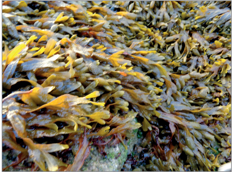
Figura 1.1 - Alga oceanica Palmaria palmata in una foto scattata ad Arcachon (Francia).

poema religioso del 563 d.C. attribuito al santo irlandese Columba di Iona (521-597) (Kenicer et al. , 2000).